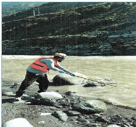
Fotografía 1: Punto de Muestreo